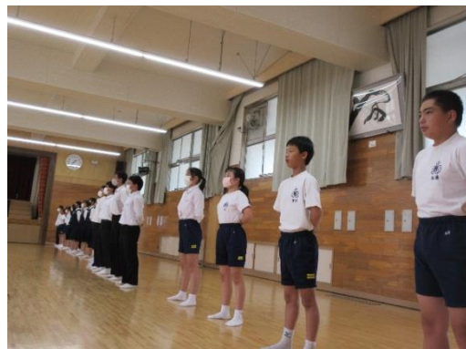
激励会練習の様子 9/28(月)