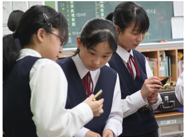
部活動で1年生に声をかける2年生