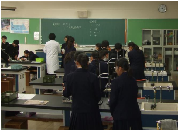
C 組 理科