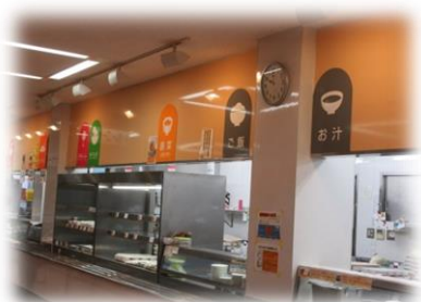
各コーナーで注文