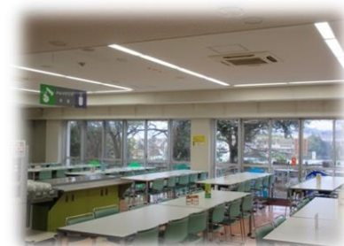
飲食座席（窓側を予約済）