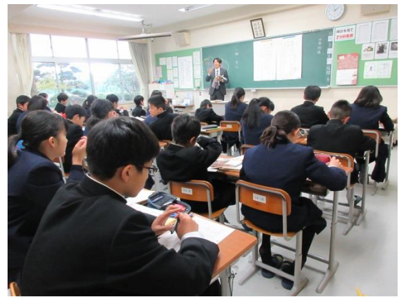
B 組 国語