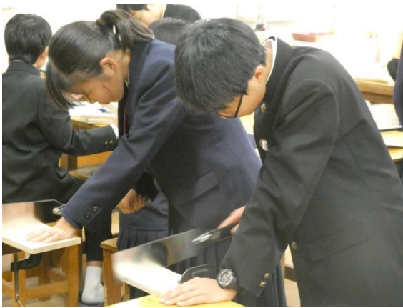
A 組 技術・家庭科