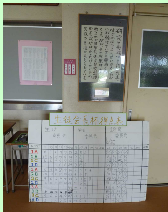
生徒玄関に掲示された一覧表