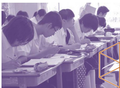
英語 (写真はすべて昨年の様子)